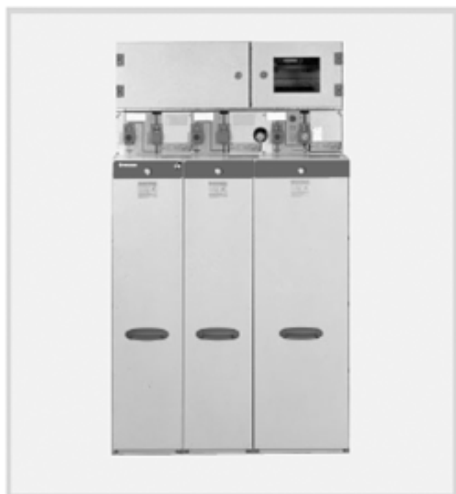
Block Typ 2K1LSF250- mit Relais- und Steuerraum, Höhe 300 mm